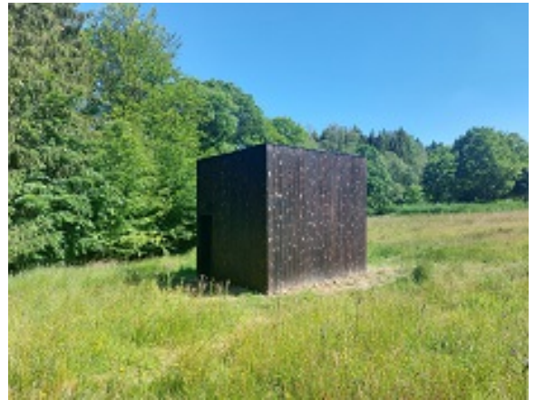
Jérôme WILOT MAUS Foyer suspendu dans ses restes