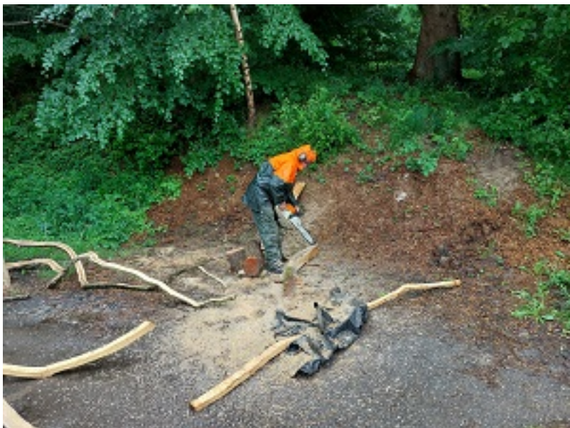
Xavier RIJS – Etat de siège