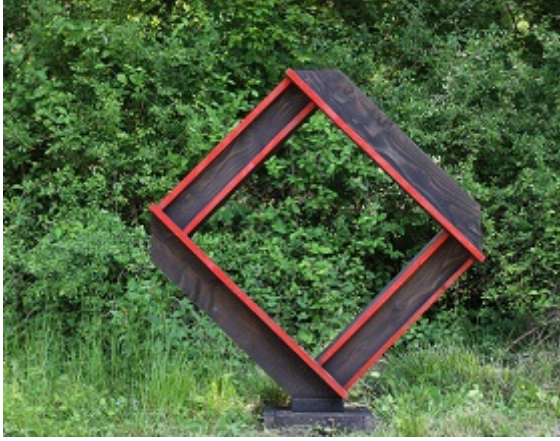
Hubert VERBRUGGEN Géométries variables